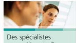
REKLAME / RÉCLAME

Home sweet home! Qui ne rêve pas d'un doux foyer! Pour le réaliser, bâtir une maison ou rénover son logement, il y a une bonne adresse en cette fin de semaine: les halles de Swiss Tennis à la route de Soleure 112 accueillent la 4 e édition de la Foire biennoise de l'Habitat, dédiée à la propriété immobilière. Elle ouvre vendredi à 14 heures et dure jusqu'à dimanche. Cette année, elle accueille un mélange éclectique d'exposants et de partenaires de tout le secteur de la construction: maisons d'architecte, domotique, construction en bois, technique solaire, wellness, financement et assurances. Le centre d'information «Efficacité